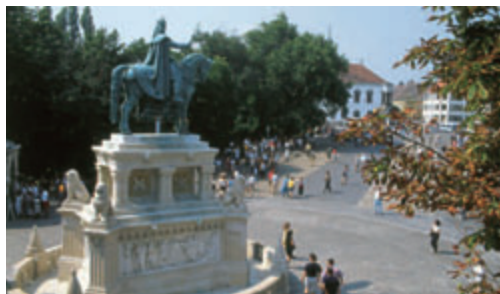
Szent István király szobra a Mátyás-templom előtt

kori állapotának visszaállítására törekedtek. A világháborús pusztítások ellenére az istenháza régi pompájában ragyog. A főhomlokzat domborműve a Madonnát ábrázolja gyermekével,