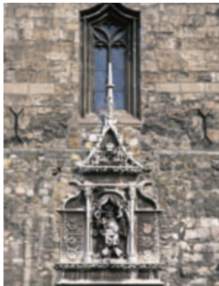
Mátyás királyi ábrázoló dombormű