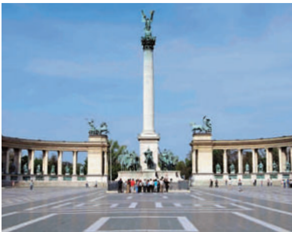
A Hősök terén páratlan múzeumokat, mellette egy hangulatos parkot találunk