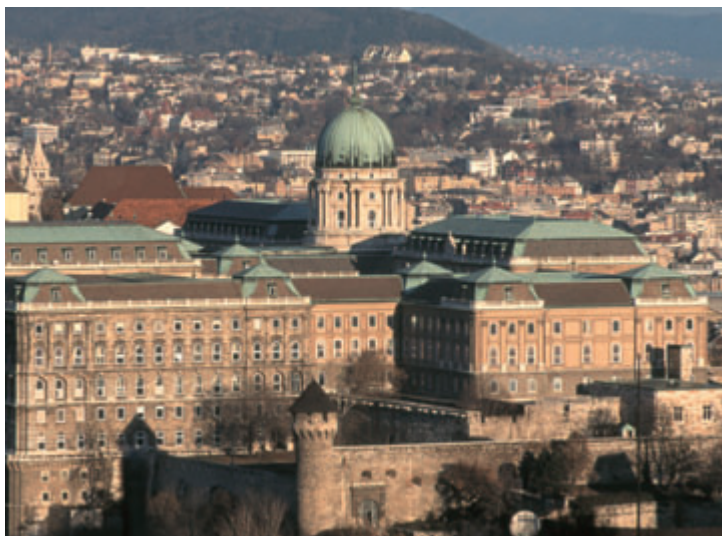
A királyok lakhelye, a Budai Vár