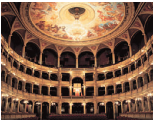
Az Állami Operaházban kiváló előadásokon vehetünk részt