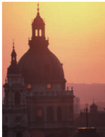
A Szent István- bazilika kupolá- jából lélegzet- elállító kilátás nyílik Budapestre