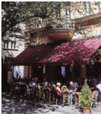
Budapest éttermei híresek vendégszeretetükről és kiváló ételeikről