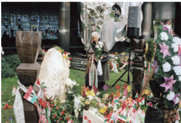
Az emlékezés virágai az 1956-os emlékműnél