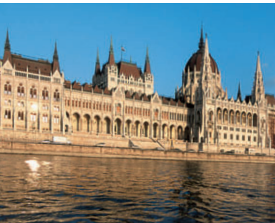
A Parlament impozáns, neogótikus épülete a Duna partján