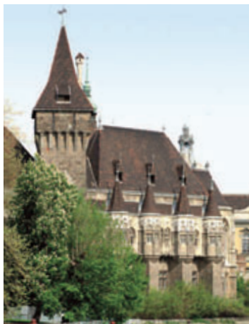
Az eklektikus stílusban épült Vajdahunyad vára romantikus hangulatot áraszt