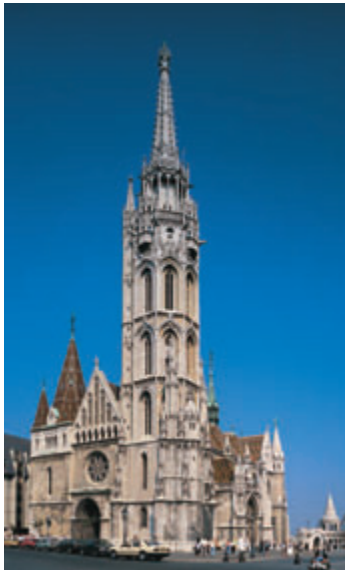
A Mátyás-templom gótikus tornya 72 méter magas

tár impozáns épülete, melyet 1920-ban emeltek neoromán stílusban, itt őrzik az ország legfontosabb dokumentumait. Ha a Fortuna utcán indulunk tovább, több olyan lakóépület mellett haladunk el, melyek a korábbi idők emlékeit őrzik: a 14. szám alatt gótikus maradványokat vehetünk szemügyre. A 10. számú háznak szép dongaboltozatos kapualja van, a barokk épület a máltai lovagrend tulajdonában volt. A 9. szám alatti épületet az 1700-as években emelhették barokk stílusban, a homlokzaton a Fortuna istennőt ábrázoló dombormű 1921-ből való. A Hess András téren találjuk a pompás, barokk stílusú Fortuna-házat, itt működött Hess András nyomdája, és itt készítette az első könyvet, a Budai krónikát 1473-ban. A tér túloldalán a Várnegyed egyik legrégebbi háza, a Vörös Sün-ház áll, a klasszicista épületben vendégfogadó várta vendégeit már a 17. század óta. A Szentháromság tér nevét az itt ma gasodó pestisoszlopról kapta, melyet az 1691-es járvány után állítottak, 1709-ben pedig egy nagyobbra cseréltek. (A ma itt látható emlékmű csak másolat, a második világháborúban megrongált eredetit a Kiscelli Múzeumban őrzik.) A téren várja látogatóit a Várnegyed legszebb látnivalója, a Nagyboldog - asszony- vagy Mátyás-templom (nyitva H-P 9–17, Szo 9–12, V 13–17 óráig, belépődíj van). Egykor talán egy Szent István alapította istenháza állhatott e helyütt, majd a tatárjárás után IV. Béla